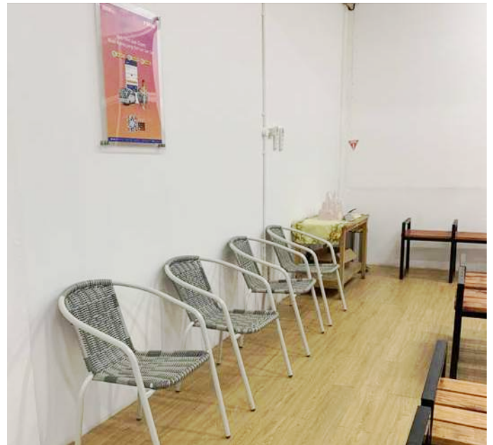
Area Kursi Tunggu Pelanggan

Pada ruang tunggu ini juga terdapat pelayanan penjualan tiket perjalanan dengan segmen AKAP untuk rute Jakarta- Surabaya/Malang dan rute Jakarta-Wonosobo. Tampilan area penjualan tiket dilengkapi dengan tagline DAMRI yaitu DAMRI Takes You Everywhere , sebagai ciri khas dari area loket atau penjualan tiket DAMRI.