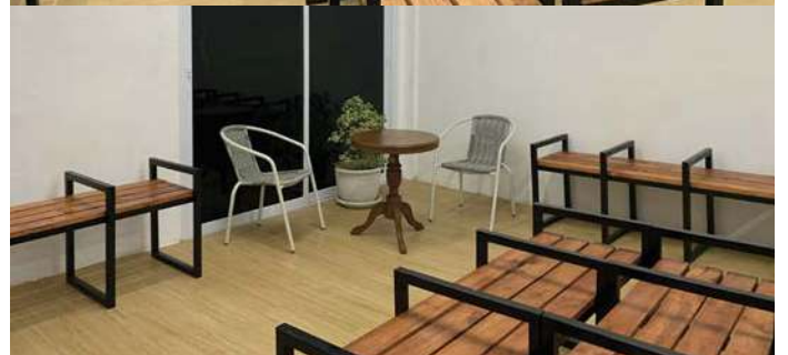
Area Kursi Tunggu Pelanggan