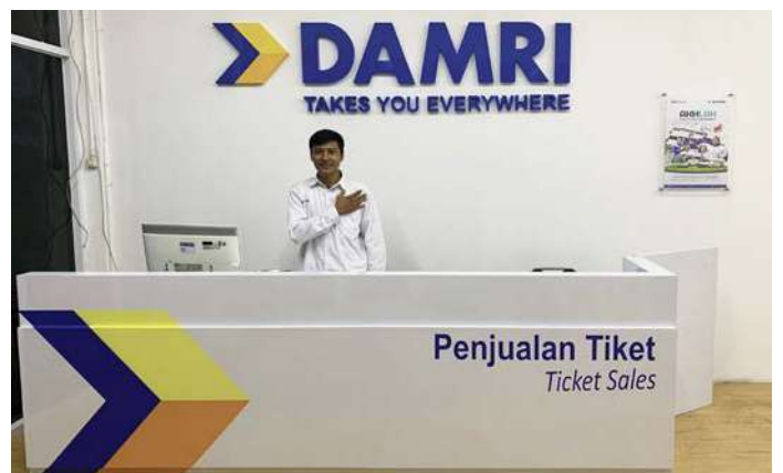
Area Penjualan Tiket (Loket)

Demi kenyamanan pelanggan, DAMRI senantiasa memberikan kemudahan penyediaan akses transportasi dan upaya peningkatan kenyamanan fasilitas untuk kepuasan Pelanggan. Salah satunya adalah fasilitas ruang tunggu yang merupakan tempat berkumpulnya penumpang saat sebelum keberangkatan seperti tempat duduk, AC ( Air Conditioner ), penjualan tiket perjalanan, dan lain-lain.